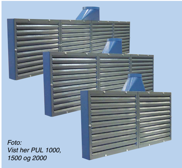
Foto: Vist her PUL 1000, 1500 og 2000